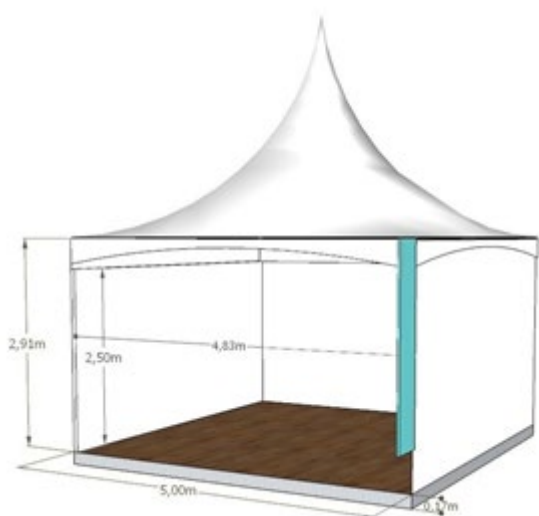
Photo d'illustration de l'implantation des tentes au P2